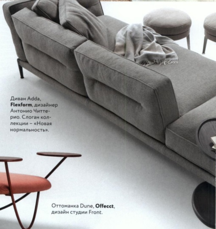
Диван Adda, Flexform , дизайнер Антонио Читтерио. Слоган коллекции – «Новая нормальность».

Иногда в рамках одной модели (Kartell, Ton, MDF), чаще внутри коллекции. Выбор за вами.