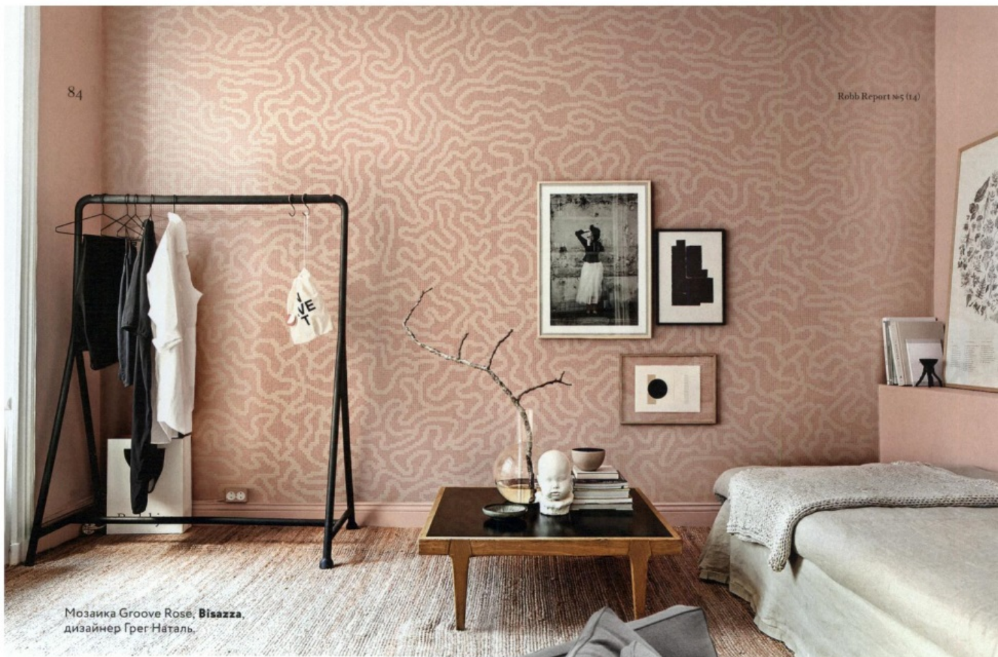
Мозаика Groove Rose, Bisazza , дизайнер Грег Наталь.