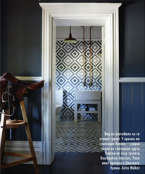
Вид из гостиной на туалетный туалет. У входа installation Natalie — старая скакалка на тончайшем круже. Скакалка на полу туалета, Bourkestone Interiors. Ручка на кухне в Дублине, Крис, John Walker.